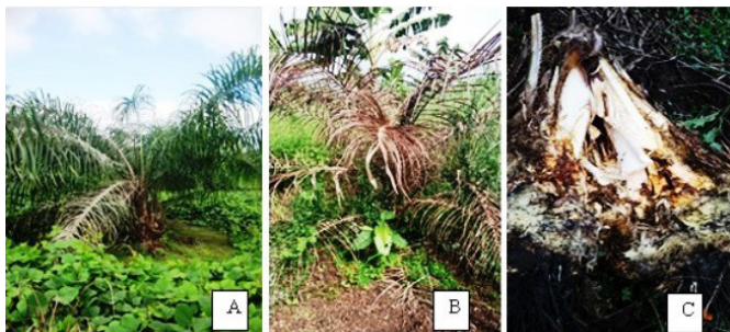
Fig. 3: A) Planta con síntomas de avance de una pudrición de flecha. B) Planta totalmente afectada por una extraña pudrición de hojas adyacentes al cogollo. C) Meristemo totalmente necrosado.