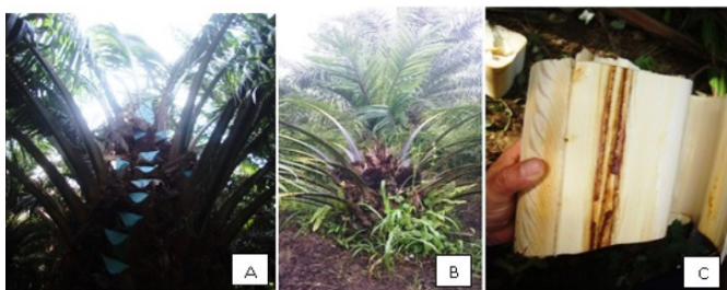
Fig. 2: A) Planta donde se ha realizado cirugía fitosanitaria. B) Planta recuperada, luego de haber realizado la cirugía. C) Tejido vascular necrosado.